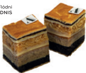
Flódnis ANGELO & A FLÓDNIS

Vitán felül áll, hogy a reggeli az egyik legfontosabb étkezés, amely meghatározza produktivitásunkat és napunk hangulatát. Egy friss, aromás kávé a BRÓT by Villa Bagatelle és a Coffee Lenoa kínálatából remek napindító lehet, de akár otthonában is különleges kávékat készíthet a Nespresso Vertuo Pop kapszulás kávégéppel. Ha valódi frissítőre vágyik, akkor a Fruitissimo vitaminban gazdag, kreatív íz kombinációkkal játszó smoothie-ját vagy az Activé könnyedén elkészíthető FiberShake-jét javasoljuk. Az innivalók mellé elengedhetetlen a finom harapnivaló is: egy szelet süteménnyel az Angelo & A Flódnis pultjáról energikusan indíthatja napját.