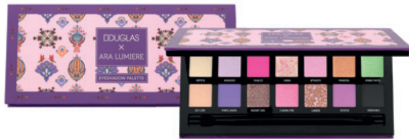
Make-up Ara Lumiere Eyeshadow Palette szemhéjpaletta DOUGLAS 9 990 Ft