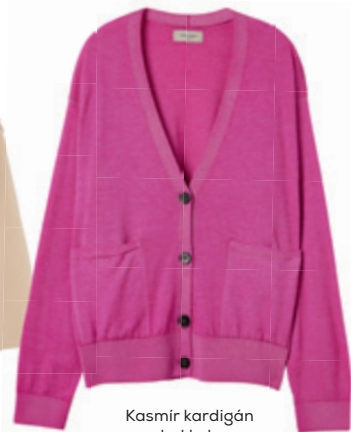
Kasmír kardigán gombokkal FALCONERI 86 000 Ft