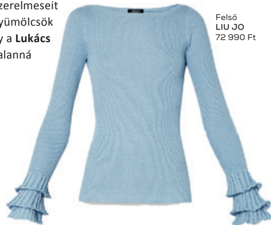
Felső LIU JO 72 990 Ft