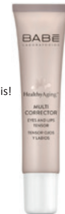
BABÉ Healthy Aging+ Multi Correct mimikai ráncokra EVITAL 6 710 Ft