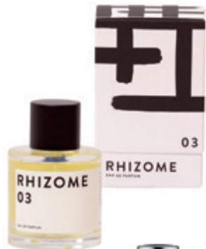
Rhizome 03 100 ml LE PARFUM 39 000 Ft