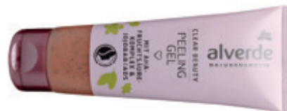
alverde Naturkismetik AHA hámlasztó gél Clear Beauty DM 1 499 Ft

A nyári hónapok közeledtével fontos, hogy bőrünket is felkészítsük a nap erejére. A dm hámlasztó gélje a tisztításért és az üde arc bőrért felel, a Bobbi Brown arckrémjei intenzív hidratálást biztosítanak, és a Le Parfum polcain is találhatóak olyan kozmetikumok, amelyek restrukturálják és fiatalítják a bőrt. Az Evital -ban kapható Multi Correct korrigálja a megjelenő mimikai ráncokat, a City Spray pedig UV-sugárzás ellen nyújt védelmet. Az Adrienne Feller termékei természetes összetevőkkel táplálják a bőrt, miközben védenek a környezeti hatásoktól is. Használja őket megfelelő rendszerességgel, hogy bőre egészséges és ragyogó maradjon a legnagyobb melegben is!