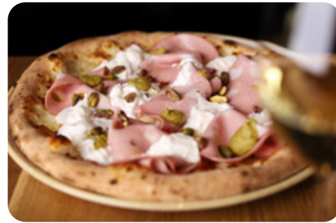
Pizza Gourmet LOCALINO