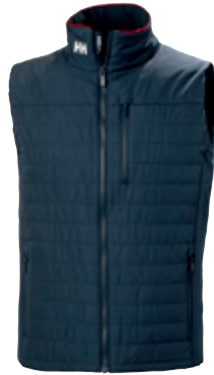
Crew Insulator Vest HELLY HANSEN 55 990 Ft