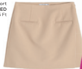
Bézs skort RESERVED 8 995 Ft