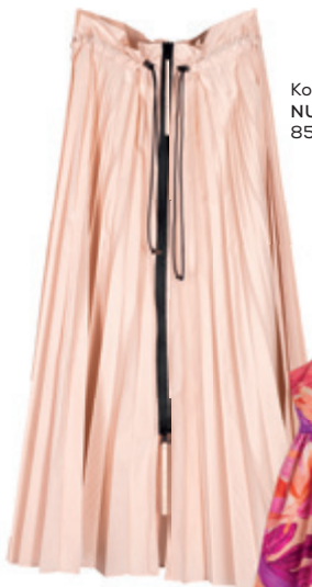
Korian skirt NUBU 85 900 Ft

A virágba borult fák és az élénk színek évről évre hatást gyakorolnak a divattervezők és designerek munkáira, hogy vidám, életteli trendeket teremtsenek. A derűs tónusok a lehetőségek végtelen tárházát nyújtják. Találja meg válogatásunkban az Ön stílusához illőt, ismerje meg a MOM Park üzleteinek tavaszi kollekción!