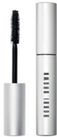
Smokey Eye Mascara szempillaspirál BOBBI BROWN 13 200 Ft

A tavasz és a nyár a színek és az életöröm ünnepei: amikor merész árnyalatokkal és élénk sminkkel kísérletezhetünk. Az Yves Rocher és a Douglas szemhéjpúdereinek világát a natúr földszínek mellett a markáns gyümölcszínek uralják — a Bobbi Brown közönségkedvenc szempillaspiráljai minden árnyalatot kiemelnek. Az idei év tónusai követik az évszakok fősodrát, a pasztell, bronz és vörös árnyalatait — fedezze fel őket a dm és Müller kínálatában!