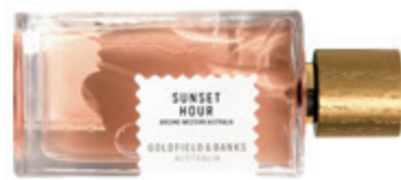
Goldfield & Banks Sunset Hour 100 ml LE PARFUM 60 000 Ft