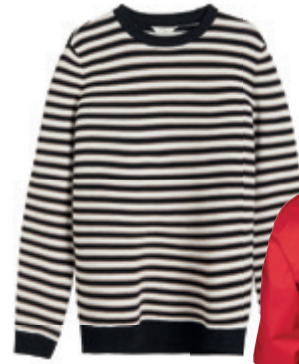
Csíkos pulóver RESERVED 11 995 Ft