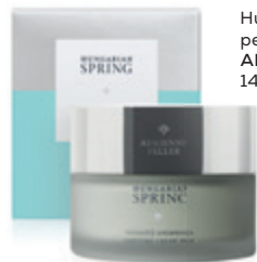
Hungarian Spring pezsdtó krémmaszk ADRIENNE FELLER 14 069 Ft

Ideje hosszú időre a szekrény mélyére számúzni a téli szetteket, és beszerezni a legújabb darabokat: a könnyű kiskabátokat, a lenge felsőket, gyönyörű ruhákat, szoknyákat, shortokat. Eljött a sneakerok, magassarkúk és szandálok ideje, a sapkák és sálak helyét pedig átvehetik a tavaszi kiegészítők: a táskák, kendők és napszemüvegek. Inspirálódjon a MOM Parkban!