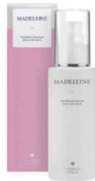
Madeleine testápoló balsam ADRIENNE FELLER 9 625 Ft