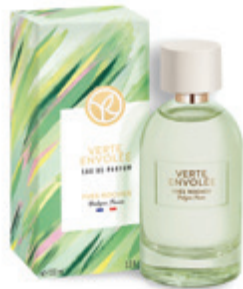
PLEINES NATURES Verte Envolée Eau De Parfum 100 ml YVES ROCHER 21 990 Ft