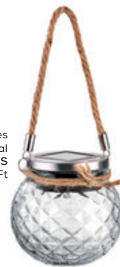
Lillisol napelemes lámpa fogantyúval BUTLERS 3 990 Ft