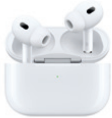
AirPods Pro (2. generáció) iCENTRE 124 990 Ft