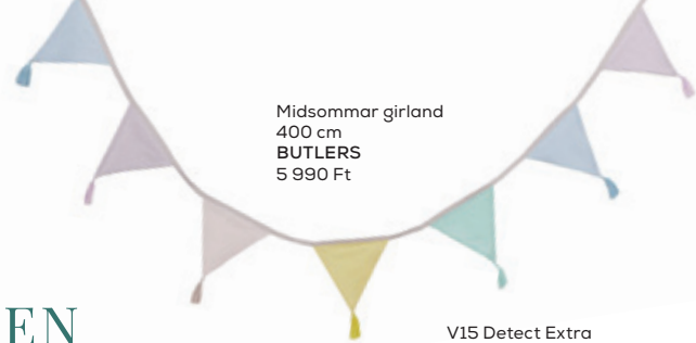
Midsommar girland 400 cm BUTLERS 5 990 Ft