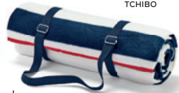
Pikniktakaró víztaszító réteggel TCHIBO