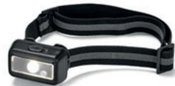
Ledes fejlámpa TCHIBO