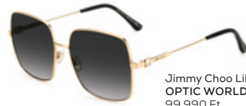
Jimmy Choo Lili/S 2M2 OPTIC WORLD 99 990 Ft