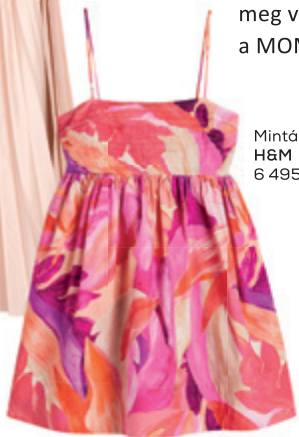
Mintás miniruha H&M 6 495 Ft

A virágba borult fák és az élénk színek évről évre hatást gyakorolnak a divattervezők és designerek munkáira, hogy vidám, életteli trendeket teremtsenek. A derűs tónusok a lehetőségek végtelen tárházát nyújtják. Találja meg válogatásunkban az Ön stílusához illőt, ismerje meg a MOM Park üzleteinek tavaszi kollekción!