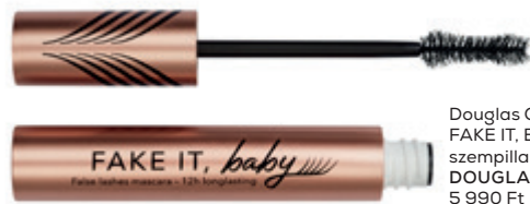
Douglas Collection FAKE IT, Baby szempillaspirál DOUGLAS 5 990 Ft