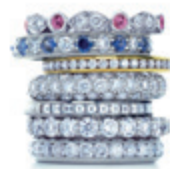
Kék zafir, és rózsaszín gyémánt gyűrű LUKÁCS ÉKSZER