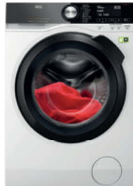
L9FBB49B előtöltős gőzfunkciós, Wi-Fi-s mosógép AEG márkabolt