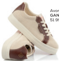
Avona sportcipő GANT 51 990 Ft

Önt is megihletti a természet? Nincs egyedül vele: divatüzleteink tavaszi kollekciói is inspirálódnak belőle. A GANT és a Reserved is a földszínekből merít, míg a Karl Lagerfeld a rattan hatású anyaghasználatával játszik. A Falconeri kasmír felhasználásával ötvözi a finom olasz eleganciát, a Liu Jo -szettek szabásánál a természet formáit fedezhetjük fel. Az Elysées -ben a tavasz szerelmeseit virágszippkés ruhák is várják, a United Colors of Benetton szezonális kollekcióját pedig a gyümölcsök uralják. Párosítsa őket bátran, és válasszon hozzá egy ragyogó ékszert a Pandora -ból vagy a Lukács Ékszerből , de a Mohito polcain is talál olyan csillogó kiegészítőt, amellyel igazán kifogástalanná varázsolhatja megjelenését!