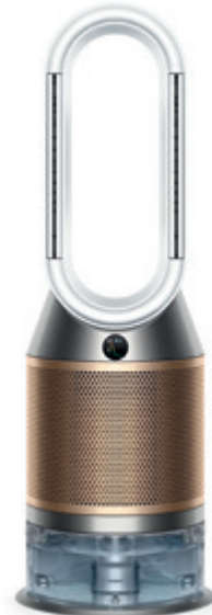
Dyson Purifier Humidify + Cool Formaldehyde légtisztító párasító PH04 DYSON 349 990 Ft

A legnagyobb hőségben jó behúzódni a hívős lakásba megpihenni egy kicsit. A száraz levegőben jól jöhet egy Dyson légtisztító, amely nemcsak kiszűri a káros részecskéket, de párasító funkciójával frissességet biztosít. Ebben segít az iCentre okos légminőség-ellenőrzője is, amely egyenesen mobiljára küldi az adatokat. A tiszta és egészséges otthonról egy kényelmes, vezeték nélküli porszívóval gondoskodhat, az AEG mosógépe pedig gőz segítségével kisimítja és felfrissíti a ruhákat, így vasalásnál időt is spórolhat. Ha minden tiszta, jöhet egy kis csinosítás: a BUTLERS napelemes lámpája környezetbarát és dekoratív megoldást nyújt, textil girlandja pedig a vidám színekkel és mintákkal színesíti otthonunkat.