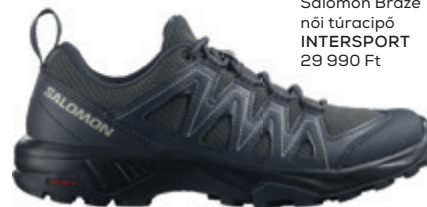
Salomon Braze női túracipő INTERSPORT 29 990 Ft