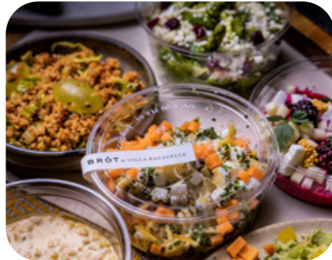
BRÓT by VILLA BAGATELLE