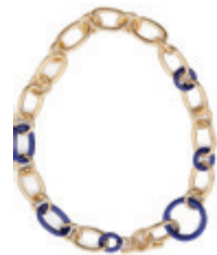
Láncos nyaklánc MOHITO 4 595 Ft