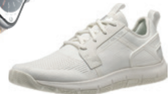
Sportcipő Henley HELLY HANSEN 47 990 Ft