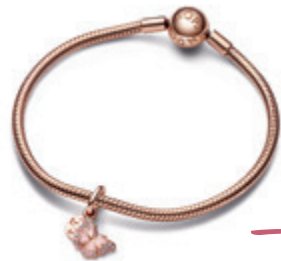
Rózsaszín pillangó és idézet dupla függő charm Moments kigyólánc karkötőn PANDORA 72 400 Ft