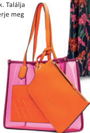
Hispanitas papaya orchid táska SALAMANDER 37 990 Ft