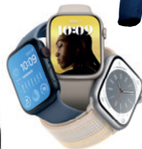
Apple Watch Series 8 ICENTRE 209 990 Ft