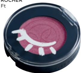
Mono szemhéjpúder YVES ROCHER 3 790 Ft

A tavasz és a nyár a színek és az életöröm ünnepei: amikor merész árnyalatokkal és élénk sminkkel kísérletezhetünk. Az Yves Rocher és a Douglas szemhéjpúdereinek világát a natúr földszínek mellett a markáns gyümölcszínek uralják — a Bobbi Brown közönségkedvenc szempillaspiráljai minden árnyalatot kiemelnek. Az idei év tónusai követik az évszakok fősodrát, a pasztell, bronz és vörös árnyalatait — fedezze fel őket a dm és Müller kínálatában!