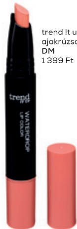
trend It up Waterdrop ajakrúzsceruza DM 1 399 Ft