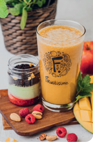
Mangós smoothie, pisztáciás-málnás cake cup FRUITISSIMO