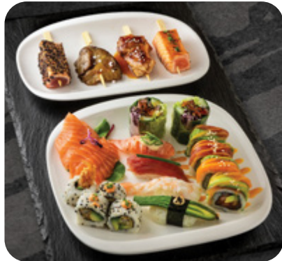
Gourmet sushi és nyárs tál WASABI