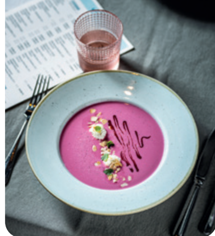
Marcipános eperkrémleves mandulás túrógombóccal LEROY BISTRO