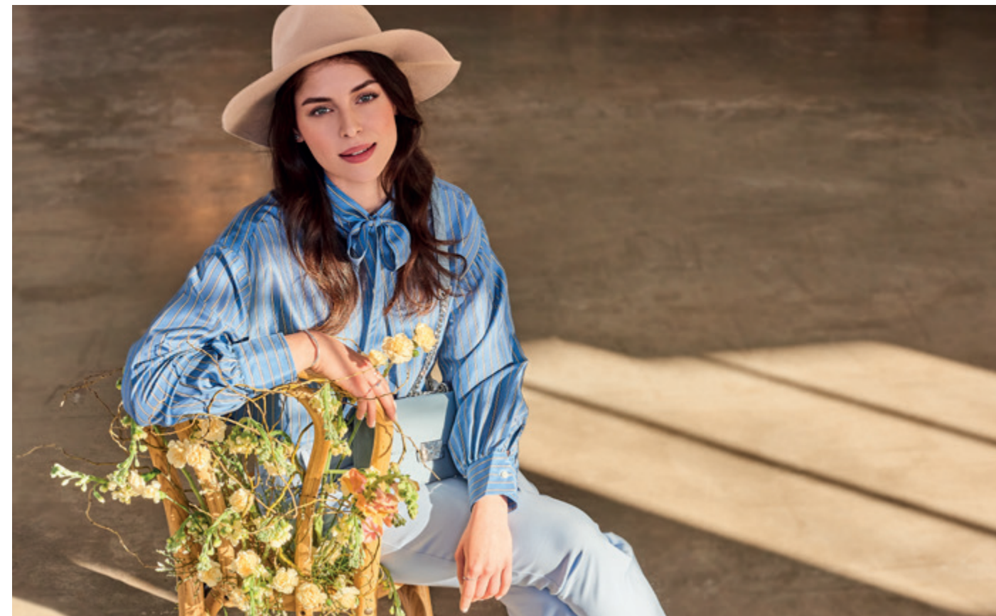
RESERVED: kalap – 10 995 Ft | GANT: blúz – 119 990 Ft | BENETTON: táska – 23 990 Ft | GERRY WEBER: nadrág – 54 995 Ft | PANDORA: gyűrűk – 9 400 Ft - 14 700 Ft / fülbevaló – 17 500 Ft / charm – 22 200 Ft BUTLERS: Wiener Melange szék – 49 900 Ft | ARIOSO: virágok és művirágok – 9 750 Ft - 18 900 Ft