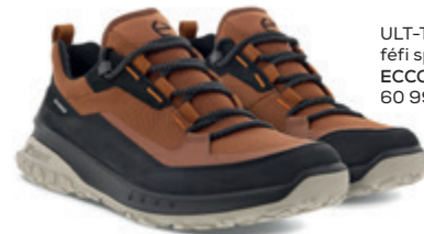
ULT-TRN férfi sportcipő ECCO 60 995 Ft