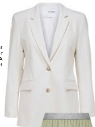
Regular fit blézer 4_SKANDINAVIA 49 990 Ft

A stílustanácsadók szerint a kifogástalan megjelenés három fő szint bír el, ez akár az élénk árnyalatok és a lágyabb tónusok párosításán is múlhat. Igazán figyelemfelkeltő lehet a H&M minije vagy a GANT virágos ruhája egy Salamander vagy Michael Kors táskával, melyek dinamikusságát egy minimalista ECCO sneakerrel finomíthatja. Ha viszont megfordítaná az arányokat, akkor találjon egy Önhöz illő, pasztellesebb színű szoknyát a Gerry Weber vagy a NUBU polcairól, hisz bátran viselheti őket egy elegáns blézerrel a 4_skandinavia -ból vagy egy zakóval az Amnesia -ból — végül megbolondíthatja outfitjét egy erőteljes árnyalatú magassarkúval a Reserved -ből, és kiegészítheti egy rosegold charm karkötővel a Pandora üzletéből. Gondolja újra bátran a fehéreneműk színét is: az Intimissimi tavaszi darabjai közt igazán csodás árnyalatokra lelhet!