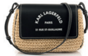
RSG Raffia Crossbody retikül KARL LAGERFELD 54 590 Ft