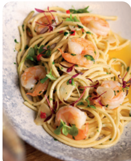
Spaghetti aglio olio e peperoncino con gamberi LOCALINO