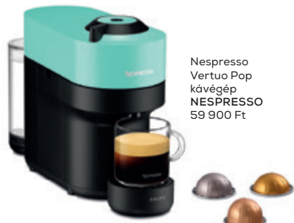
Nespresso Vertuo Pop kávégép NESPRESSO 59 900 Ft