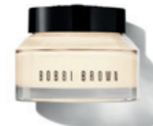
Vitamin Enriched Face Base 50 ml BOBBI BROWN 21 500 Ft