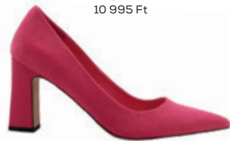
Kockasarkú pömpsz RESERVED 10 995 Ft