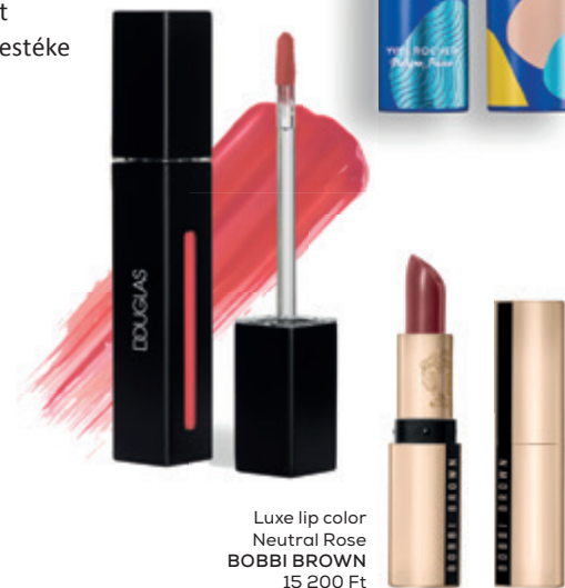
Luxe lip color Neutral Rose BOBBI BROWN 15 200 Ft