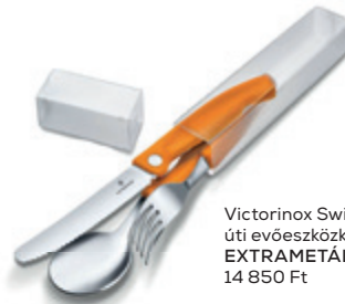
Victorinox Swiss Classic úti evőeszköz készlet EXTRAMETÁL 14 850 Ft