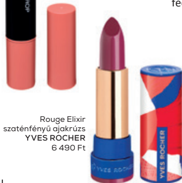
Rouge Elixir szaténfényű ajakrúzs YVES ROCHER 6 490 Ft