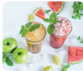
Álmás és dinnyés mohito FRUITISSIMO