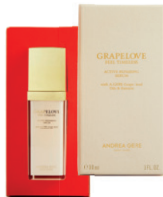
Feel Timeless Restrukturáló, fiatalító szérüm 30 ml LE PARFUM 38 900 Ft