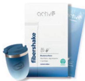
Limitált áfonyás activé FiberShake ACTIVE 5 990 Ft