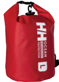
Ocean Dry Bag L-es HELLY HANSEN 19 990 Ft