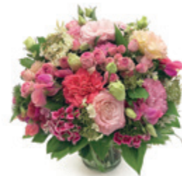
Álomszép rózsaszín szezónális csokor ARIOSO 29 900 Ft

Csempésszen egy kis vidámságot otthonába: egy gyönyörű csokorral, egy pompás virágdíszsel és a MOM Park otthondekor-üzleteinek egy-egy darabjával beköltöztetheti a tavaszt nappalijába. Ha pedig sűrű programjai engedik, töltsön több időt a szabadban! Túrázzon egyet, eddzen a saját ritmusában, piknikezzen kedvére, vagy csak sétáljon egy nagyot — bármelyikhez is legyen kedve, bevásárlóközpontunkban mindent megtalál az aktív kikapcsolódáshoz.