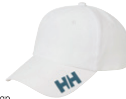
Crew Cap HELLY HANSEN 11 990 Ft