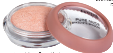
trend It up Pure Nude szemhéjpúder DM 1 199 Ft